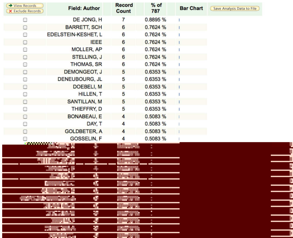
Figure 3 : Chercheurs des 4 pays francophones publiant "le plus" dans les domaines Biomathématiques, Biologie Mathématique et Biologie Théorique (copie d'une page ISI Web of knowledge)

La Figure 2 montre 4 pays francophones, parmi les pays publiant le plus dans les domaines Biomathématiques, Biologie Mathématique et Biologie Théorique. Dans ces pays, parmi les 14 chercheurs vraiment francophones, on trouve 7 membres ou anciens membres de la SFBT dans les trente chercheurs publiant "le plus" (cf. Figure 3).